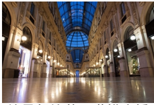
埃马努埃莱二世拱廊桥

早餐后，由意大利小镇酒店出发，前往素有世界时尚与设计之都和世界艺术之都之称的米兰进行游览。在这时尚繁华的氛围下感受纯朴古城的气息，参观【斯福尔扎城堡】和【埃马努埃莱二世拱廊桥】，以及位于城内观看世界上雄伟的哥特式建筑【米兰大教堂】。当晚入住因斯布鲁克或其周边酒店