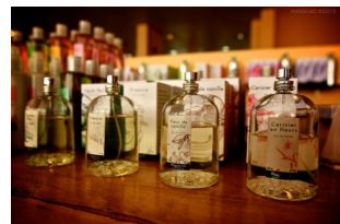
巴黎花宫娜香水博物馆