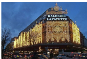
老佛爷百货公司（奥斯曼旗舰店）