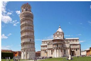
比萨斜塔及其周边